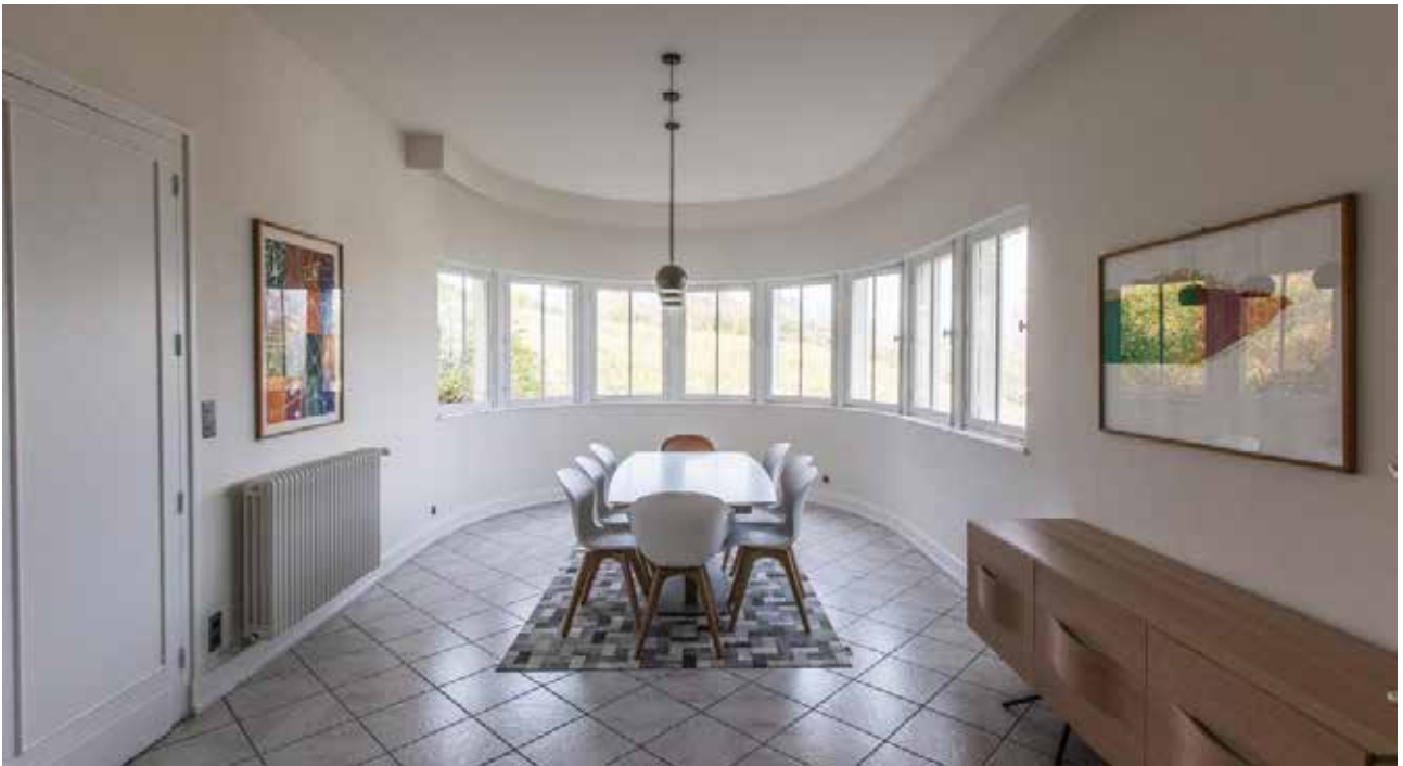
La Villa Sabourin

Comme vu précédemment, l'architecte ou le paysagiste peut proposer un binôme, en ayant connaissance et conscience des conditions proposées et des contraintes.